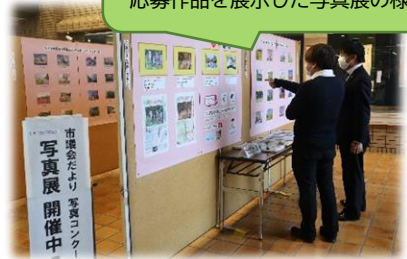
令和5年度写真コンクールにおける 応募作品を展示した写真展の様子