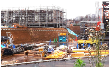
建設が進む小中学校併設校

開催された市議会全員協議会では、市長は「議決を重く受け止め、全額UR都市機構の負担とし、7月14日の臨時議会で議案を再提出する」と報告。ムダ使いに機敏に対応した議会の正しさを証明しました。