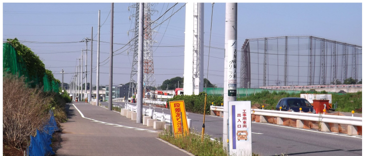
防犯灯がほとんど設置されていない『都市計画道路・中駒木線』。