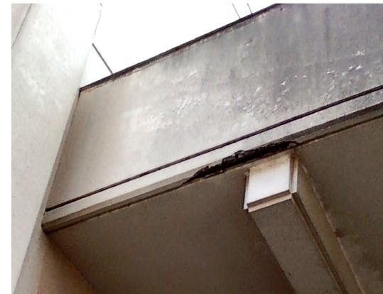
コンクリートがはく離したまま放置されている校舎