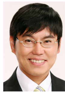
日本共産党市議会議員